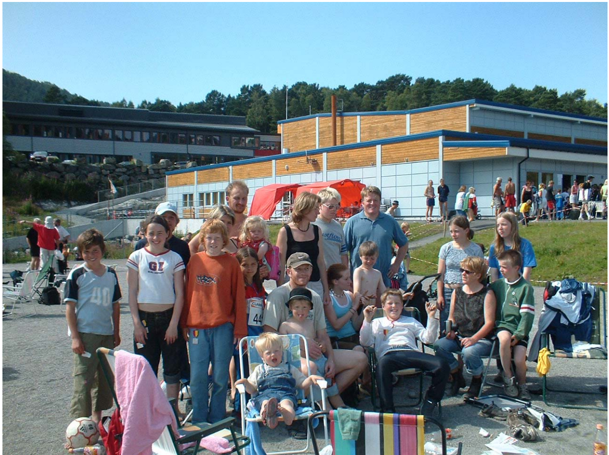
Heile (nesten) gjengen på samlingsplass

Vi hadde mange gode plasseringar, nemnast kan: